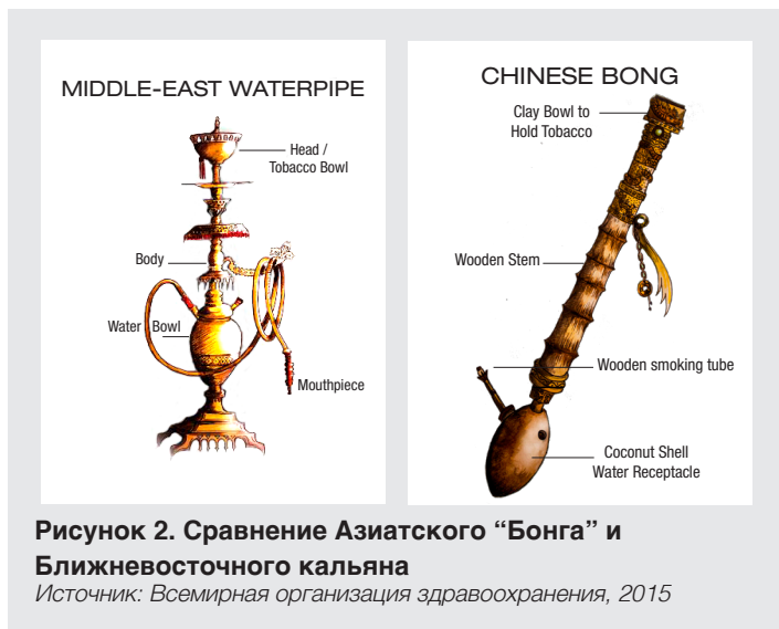
Рисунок 2. Сравнение Азиатского “Бонга” и Ближневосточного кальяна